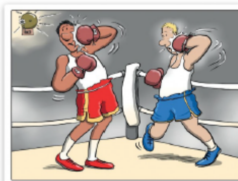
When the bell rang, the boxers started hitting themselves.

3 Why is this cartoon funny? Correct the sentence.